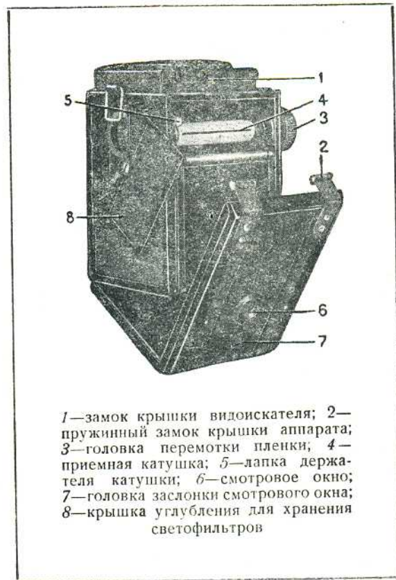
1—замок крышки видоискателя; 2—пружинный замок крышки аппарата; 3—головка перемотки пленки; 4—приемная катушка; 5—лапка держателя катушки; 6—смотровое окно; 7—головка заслонки смотрового окна; 8—крышка углубления для хранения светофильтров

1. Установить объектив на фокус по резкости изображения на матовом кружке или по шкале расстояний.